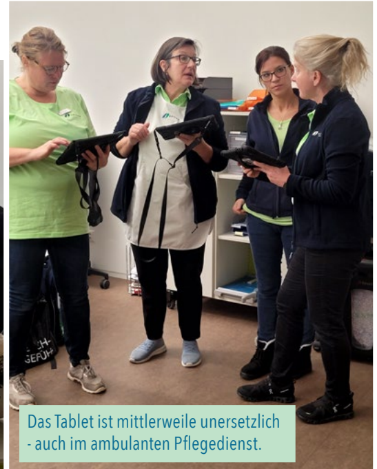
Das Tablet ist mittlerweile unersetzlich - auch im ambulanten Pflegedienst.